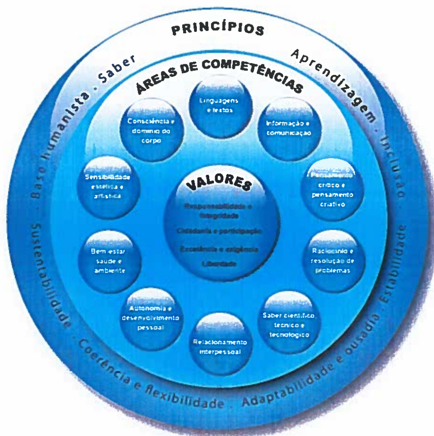
Esquema concetual do Perfil dos Alunos à Saída da Escolaridade Obrigatória